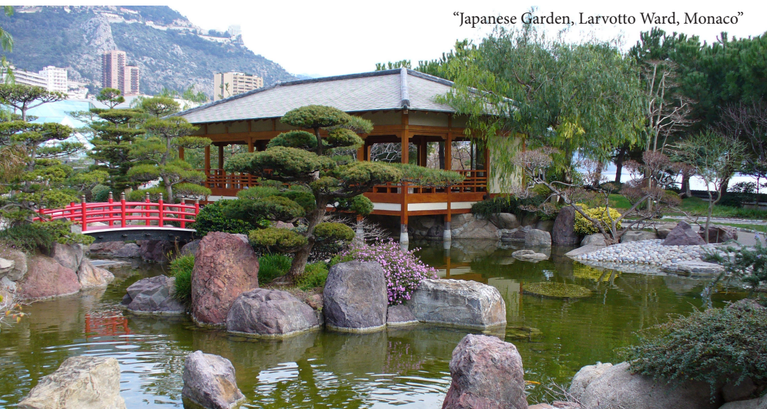
“Japanese Garden, Larvotto Ward, Monaco”

Donec elit libero, sodales nec, volutpat a, suscipit non, turpis. Nullam sagittis. Suspendisse pulvinar, augue ac venenatis front condimentum, sem libero volutpat nibh, nec pellentesque ate velit pede quis nunc.